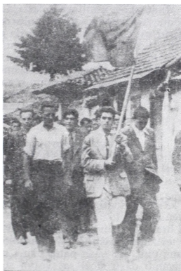
Demonstracije u Đakovici (28. novembra 1941)

Arnautima pravo na svoju zemlju, arnautskoj i ostaloj sirotinji pravo na besplatno naseljavanje na čitlucima, pravo na narodni jezik, na škole i opštinske samouprave, na slobodu veroispovesti i običaja. Tom zajedničkom borbom Crnogorci i ostali naseljenici... pomoću kojih su srbijanski vlastodršci hteli da unište Arnaute, postaću slobodni seljaci, koji neće dozvoliti da se radi njih pljačkaju i oni i Arnauti, nego da se naseljavanje i pode-la čitluka i manastirskih imanja uredi onako kako je to u interesu i Arnauta i naseljenika«.