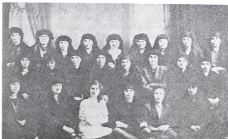
Grupa žena antifašistkinja Đakovice

sleni odgovor na pitanje: gde je mesto Albanaca, Srba i Crnogoraca sa Kosova u narodnooslobodilačkoj borbi naroda i narodnosti Jugoslavije. U tom pitanju za njega, kao ni za druge progresivne ljude ovog kraja, nije bilo nedoumice i kolebanja, čega je postojalo samo kod nedovoljno upućenih u suštinu društvenih tokova. No, kada je Emin ukazivao i na postojanje takvih ljudi on je izrazio sigurnost da će već sledeći meseci doneti novu klinu u kojoj će svakim danom rasti broj pripadnika NOP-a i revolucije.