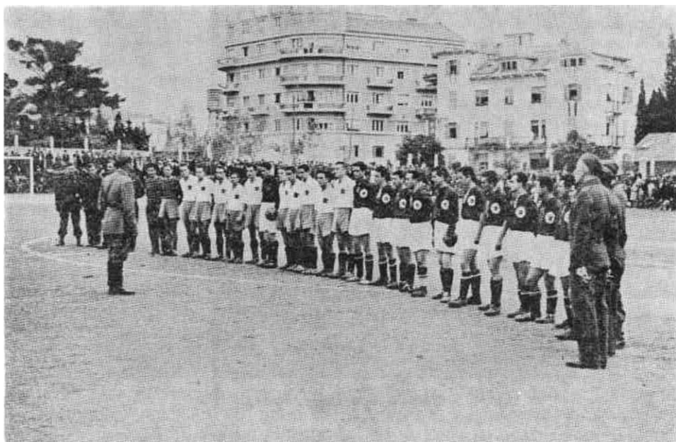
Nogometni tim 1. dalmatinske brigade i zajednički tim »Hajduka« i »Radničkog« iz Splita pred utakmicu u čast proslave oktobarske revolucije, novembra 1944.

tornata, 110 pušaka, 25 pištolja, 14 kamiona, 15 motocikala, 87 bicikala, 5 radio-stanica, dva dvogleda, 40 kola (dvoprežnih), 60 konja, 20 vagona razne municije, te razne druge opreme dva i po vagona.