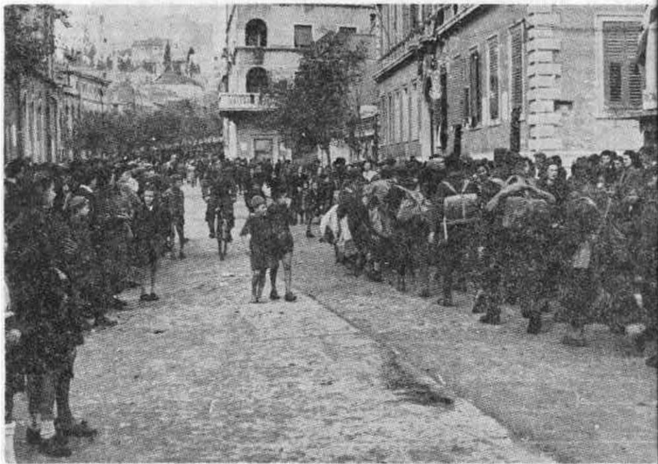
Doček 1. dalmatinske u Šibeniku 3. IX 1944.

teljskoj vatri, a na zaštitnicu je vršen sve jači pritisak. U ovom vremenu došlo je do opasnih situacija, naročito kada je neprijatelj počeo da upotrebljava minobacače... Gubici su već do ovog vremena bili znatni. Lekari i bolničari imali su mnogo posla... Borbeni moral pobočnica i zaštitnica vidno je opao, vojnici su se obično odmah po otvaranju vatre, povlačili i tražili zaklon... Citava slika dobijala je sve više izgled neuredne bežeće gomile zahvaćene panikom.« 15)