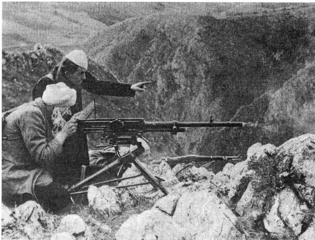
Gerilski borci u divljem kršu