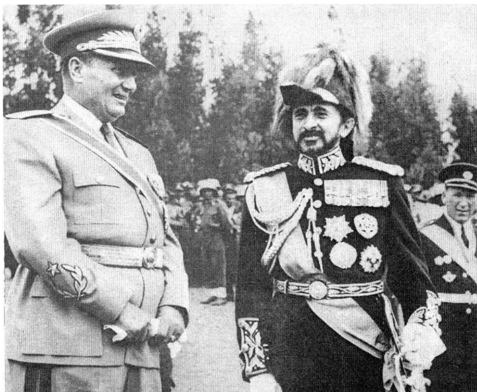
Tito kao gost kod Njegove visosti cara Etiopije Haile Selasija I. u Adis Abebi, u decembru 1955.